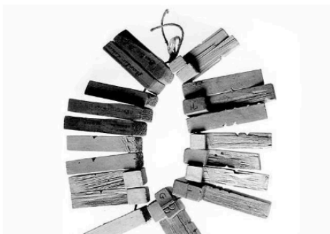
« Tailles » de l'alpage de Borter dans le Turmanntal, 1925-1967.

Par consortage, on entend une gestion communautaire du travail et des biens collectifs. Dans ce cadre, les consorts – ou corporatistes – disposent de droits et de devoirs, qui sont définis par des statuts et des règlements établis, préalablement, par écrit. La participation aux travaux communautaires (manœuvre, corvée) et la prise en charge des fonctions relèvent particulièrement des devoirs des consorts, alors que, dans les droits, figurent l'utilisation des biens et des aménagements communs.